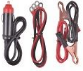
Modifiye Sinüs Dalga